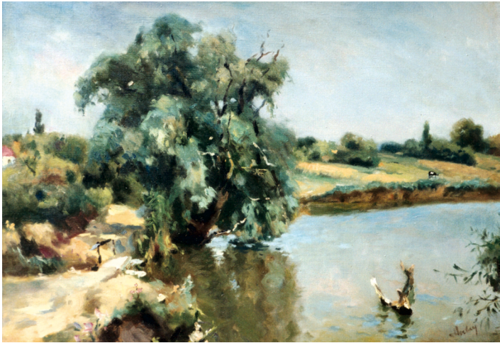
ВЕРБИ НАД СТАВКОМ