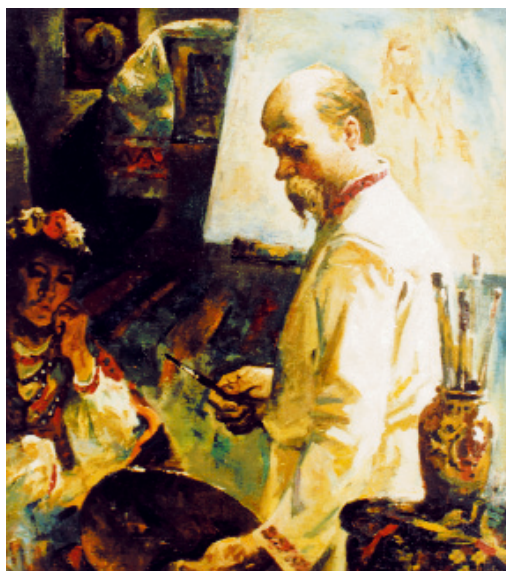
Т. Г. ШЕВЧЕНКО